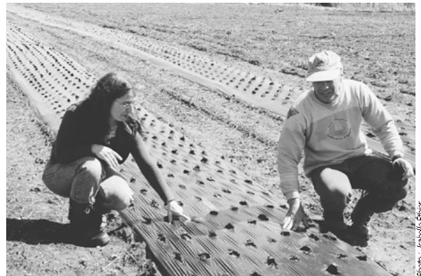
Des kilomètres de paillis de plastique pour épargner du temps et des pesticides

saïson des récoltes. « Comme nous transformons tous les plants sur place, le séchage doit se faire tout de suite après la récolte. Dans le temps du basilic par exemple, je ne suis pas du tout disponible pour aller dans le champ. Pour nous, le paillis de plastique est très avantageux pour cet aspect, d'autant plus qu'il permet de maintenir la chaleur et l'humidité du sol. Le type de sol étant un loam sablonneux, le paillis de plastique favorise une régularité